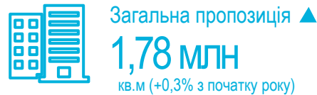
Вакантність та орендні ставки на приміщення класу А та В на кінець 1 кварталу 2019